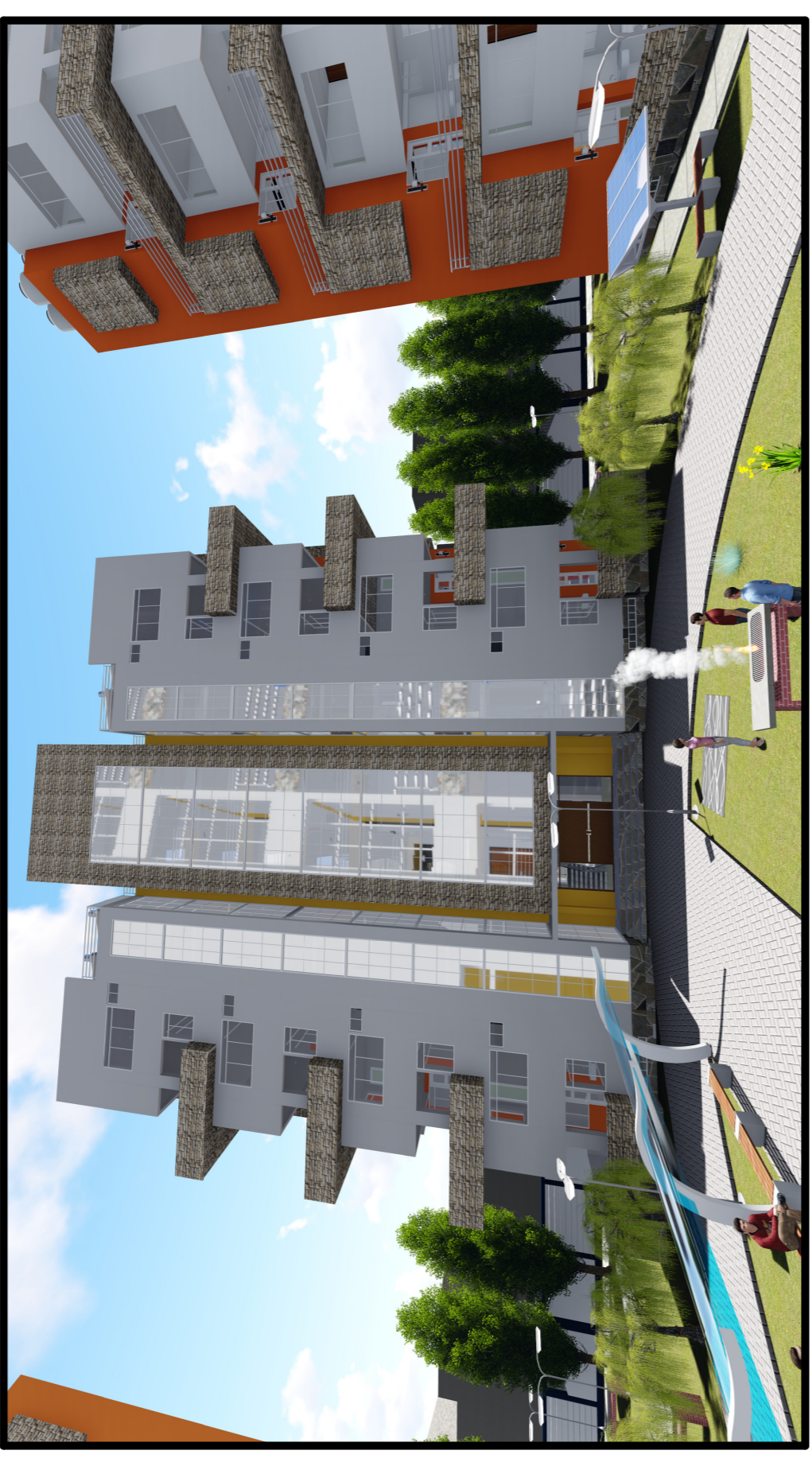
MODELADO 3D DE ELEVACION HACIA EL INTERIOR DEL CONJUNTO HABITACIONAL