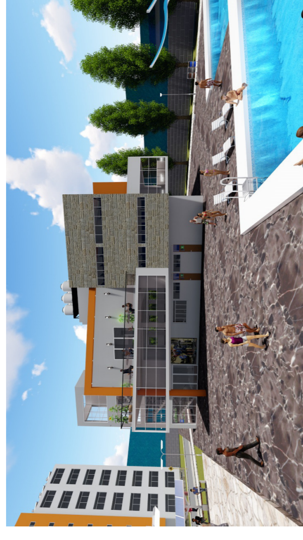
BLOQUE 04 EN RENDERISADO