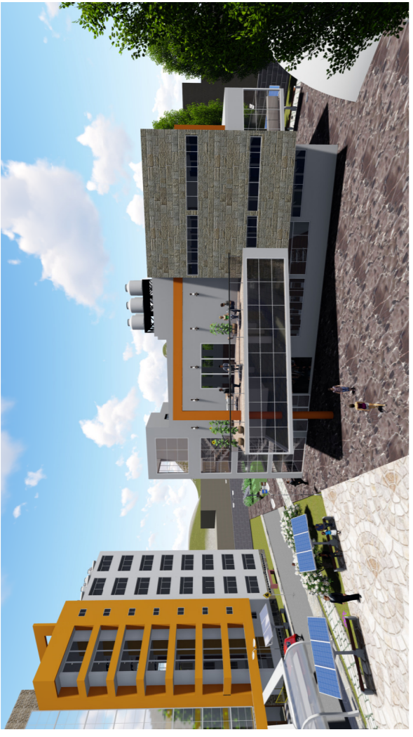
BLOQUE 04 EN RENDERISADO