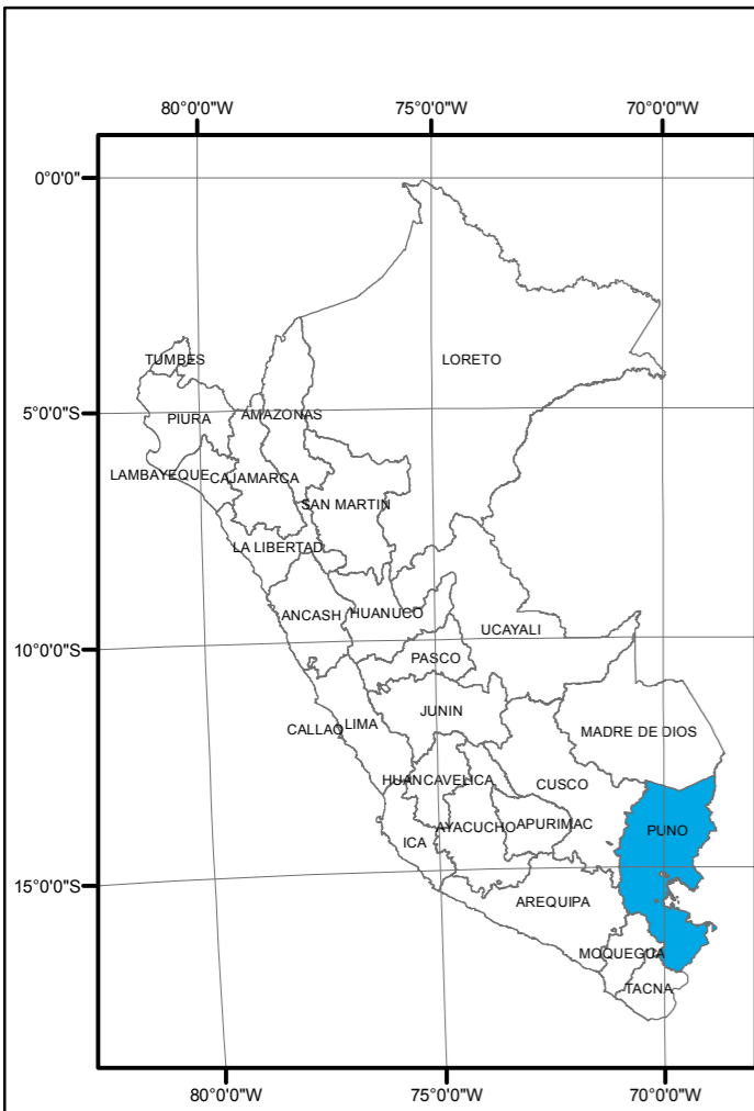
MAPA POLITICO DEL PERU 1:20,000,000