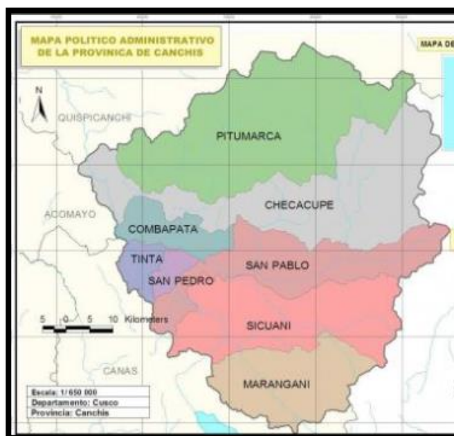
GRAFICO N° 01 UBICACIÓN DISTRITAL

El distrito de Sicuani se encuentra ubicada en la provincia de Canchis, departamento de Cusco.