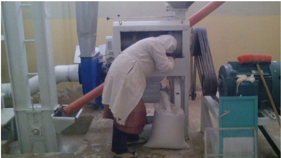
Ilustración 5 Trabajadora haciendo la limpieza de la maquina escarificadora.

Fuente propia en base a la observación participante.