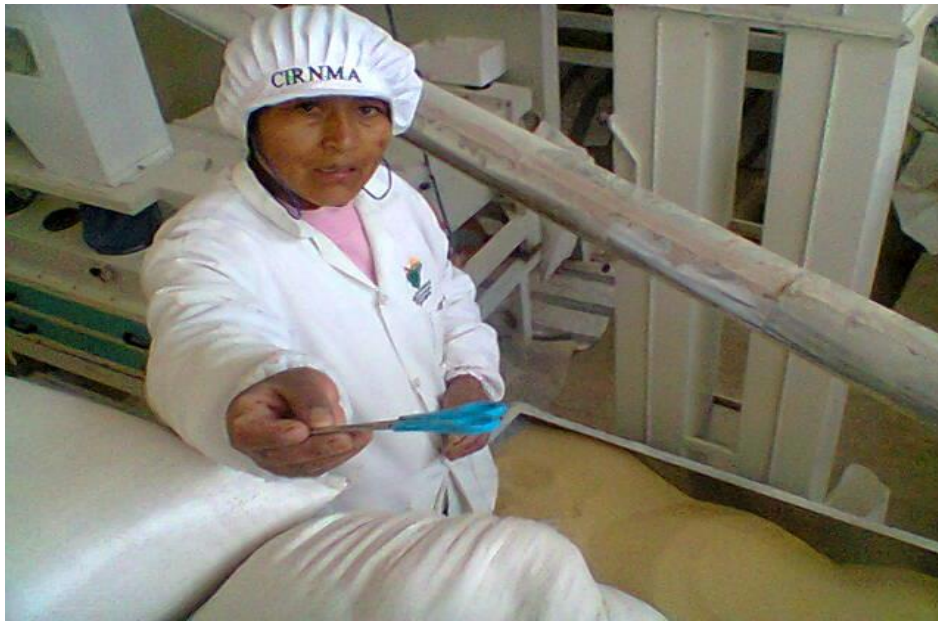
Ilustración 4 Trabajadora Cirnma S.R.L., en la tolva de la máquina