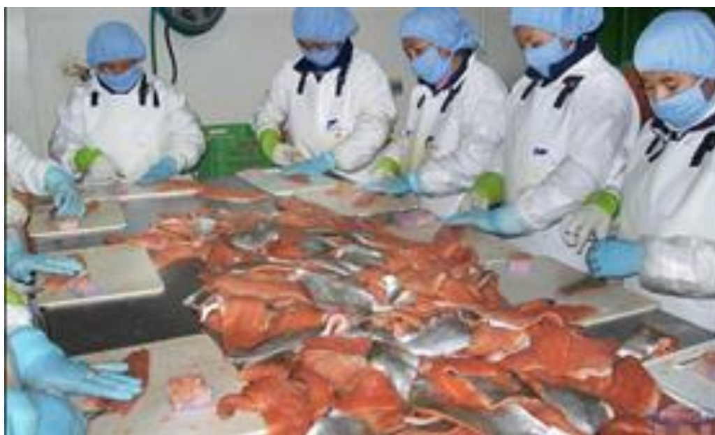
Ilustración 10 Trabajadoras de la empresa Piscis, deshuesando la trucha.