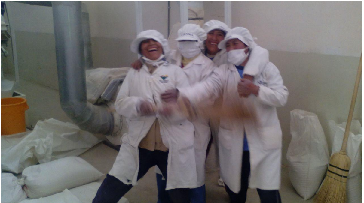
Ilustración 3 Trabajadoras de Cirnma S.R.L. dentro de la planta procesadora.