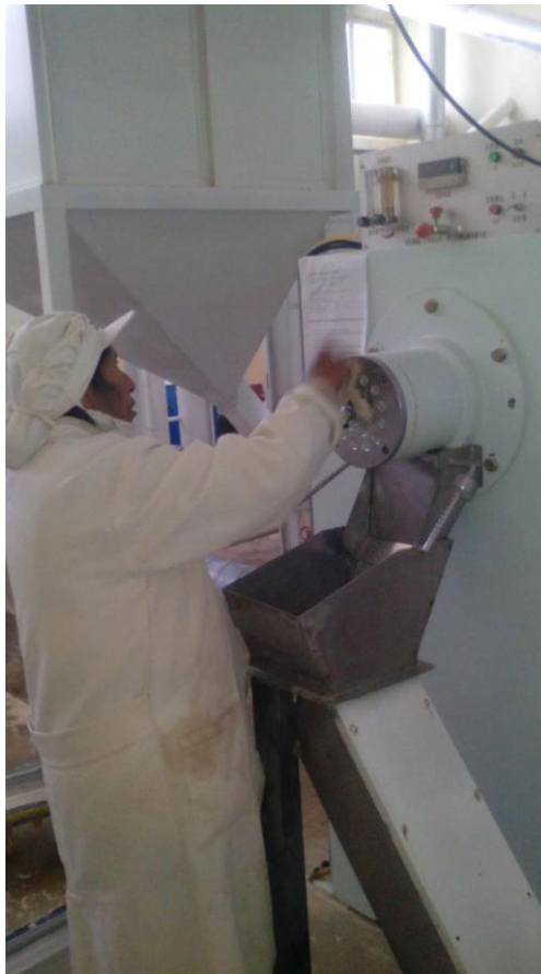
Ilustración 6 Trabajadora en la máquina de pulido de quinua.