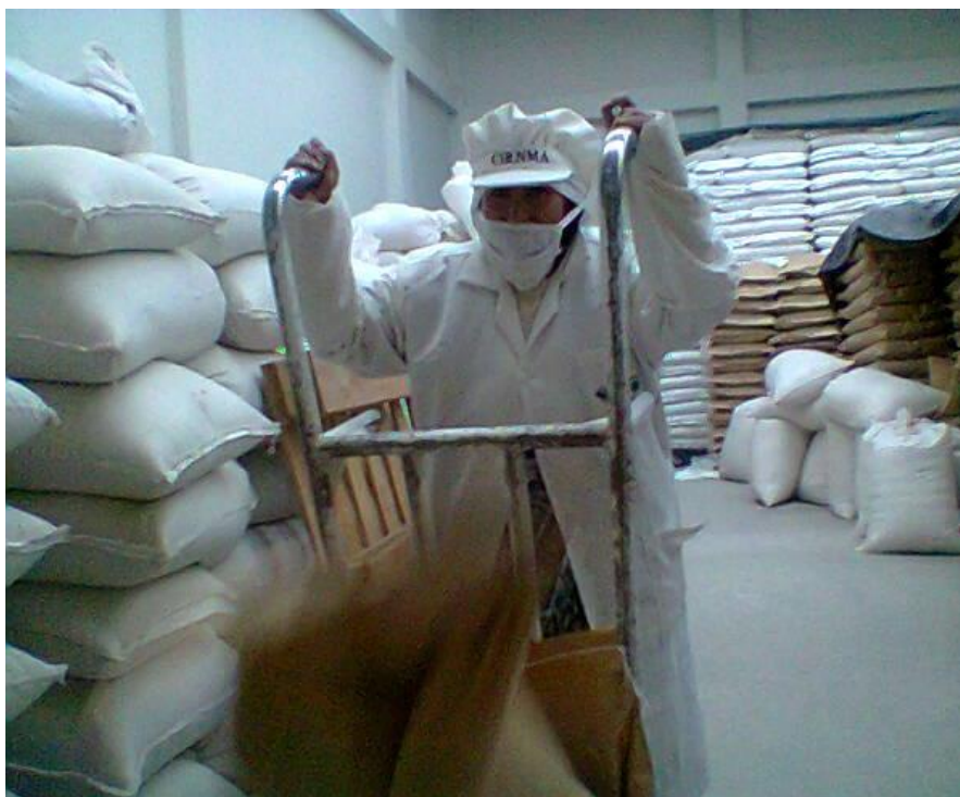
Ilustración 8 Trabajadora de Cirnma S.R.L, estibando el producto terminando.