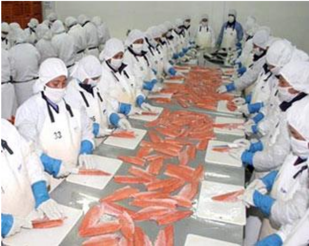
Ilustración 11 Trabajadoras de la empresa Piscis, fileteando la trucha.