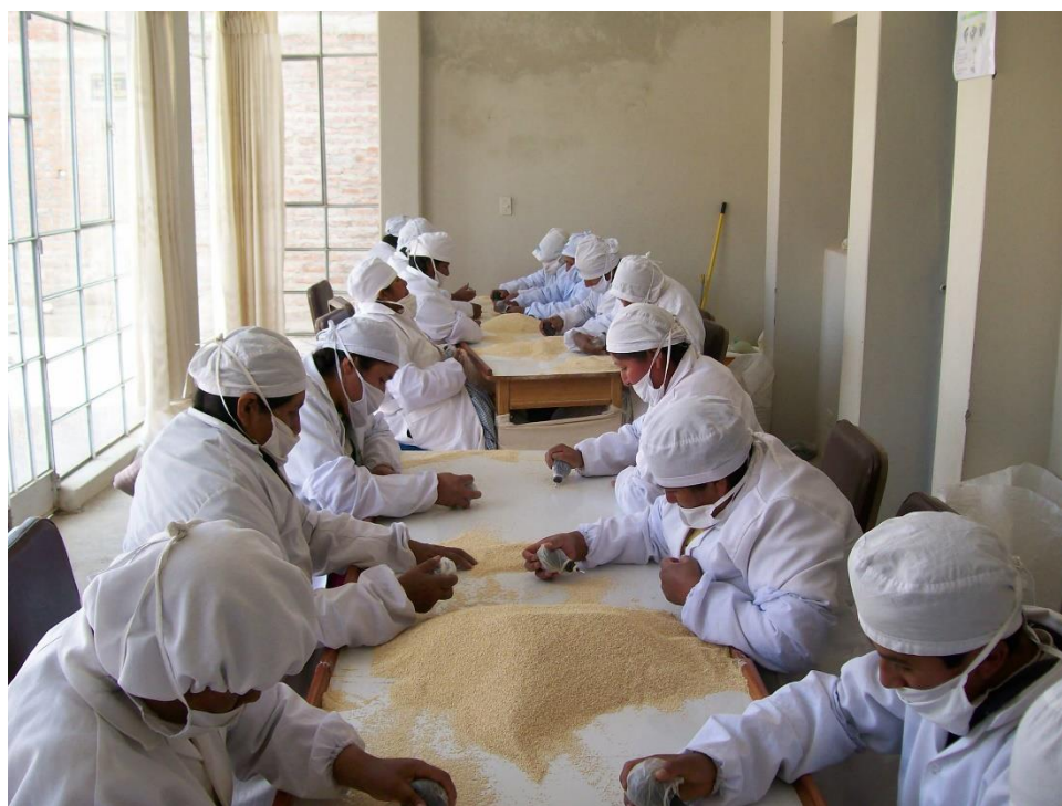
Ilustración 7 Mujeres de la empresa Cirnma S.R.L., escogiendo puntos negros de quinua.