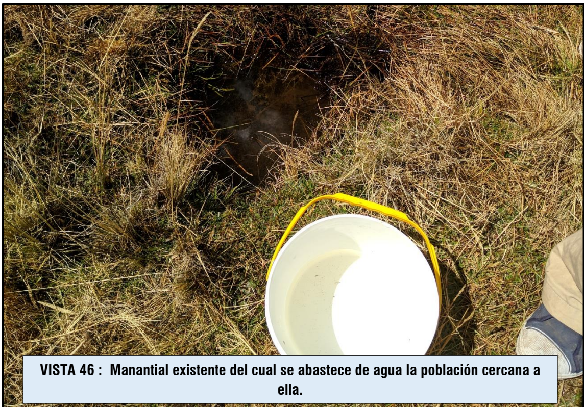
VISTA 46 : Manantial existente del cual se abastece de agua la población cercana a ella.