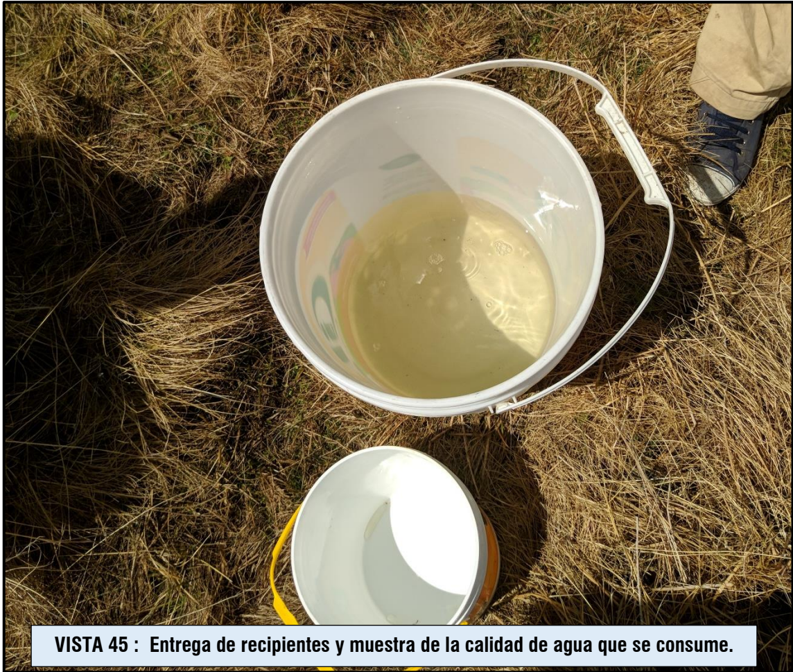
VISTA 45 : Entrega de recipientes y muestra de la calidad de agua que se consume.