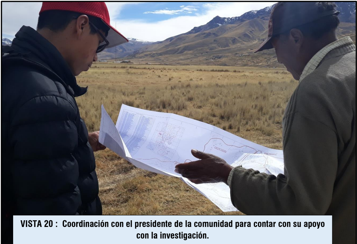
VISTA 20 : Coordinación con el presidente de la comunidad para contar con su apoyo con la investigación.