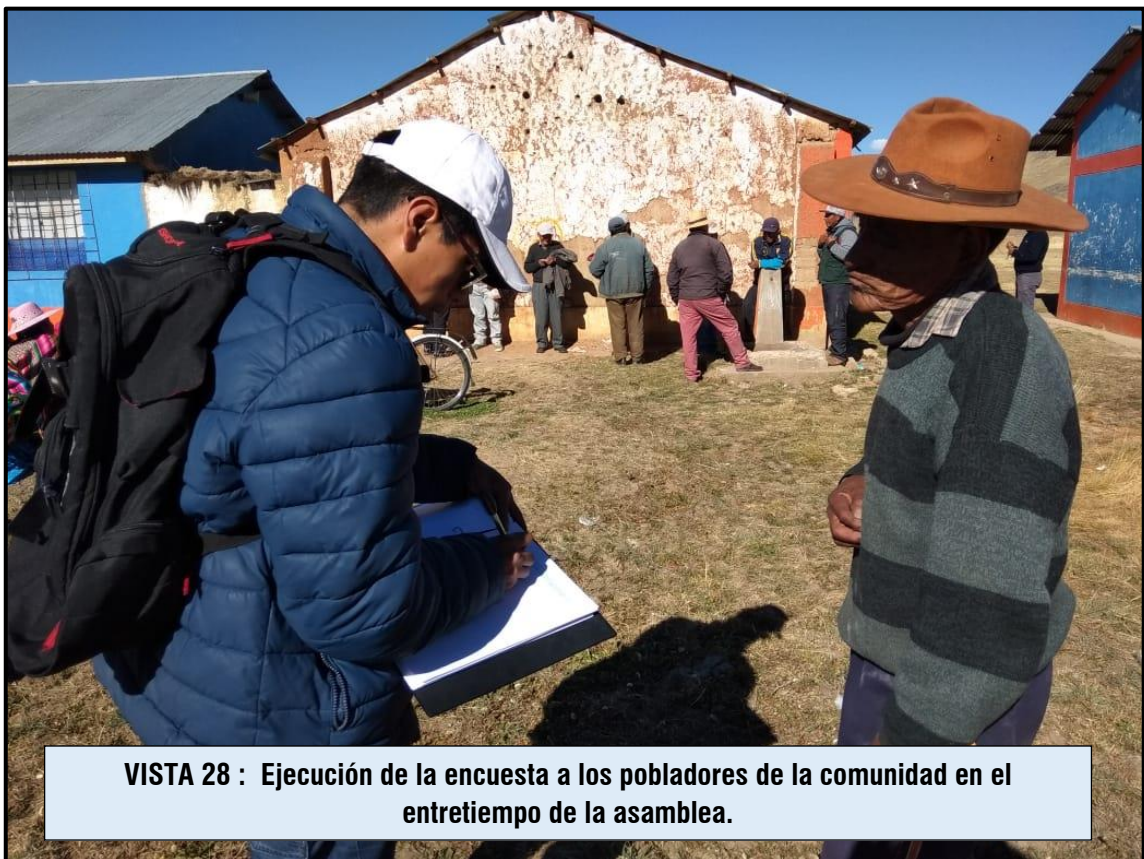
VISTA 28 : Ejecución de la encuesta a los pobladores de la comunidad en el entretiempo de la asamblea.