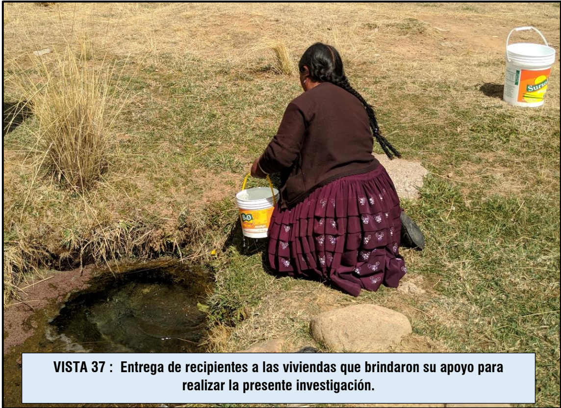
VISTA 37 : Entrega de recipientes a las viviendas que brindaron su apoyo para realizar la presente investigación.