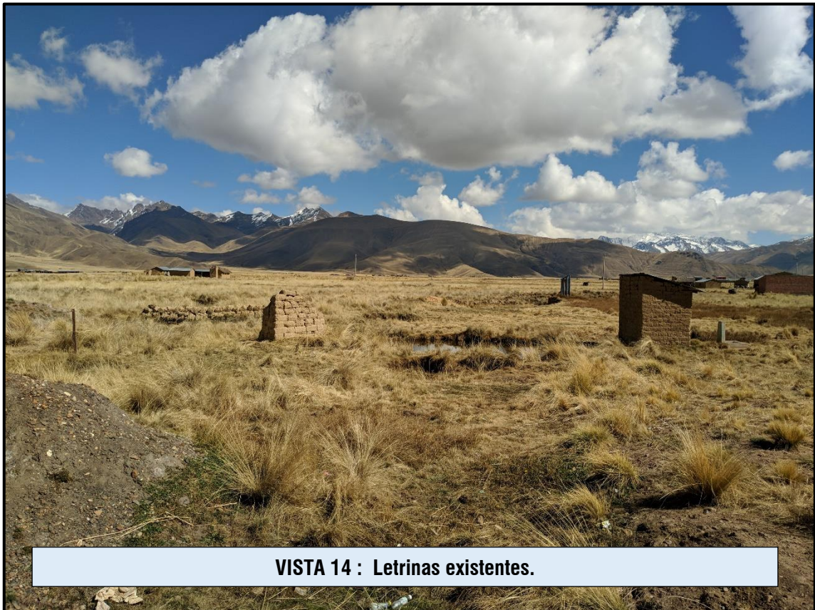
VISTA 14 : Letrinas existentes.