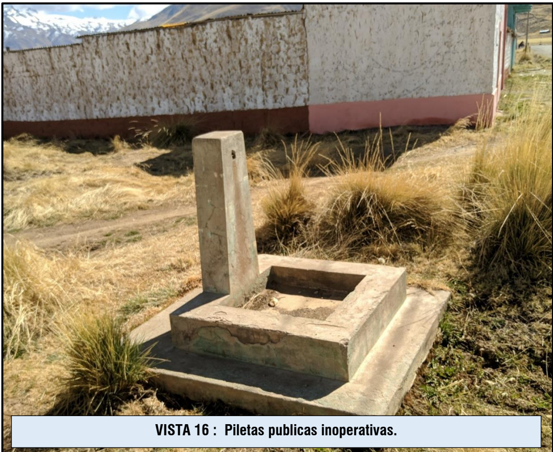
VISTA 16 : Piletas publicas inoperativas.