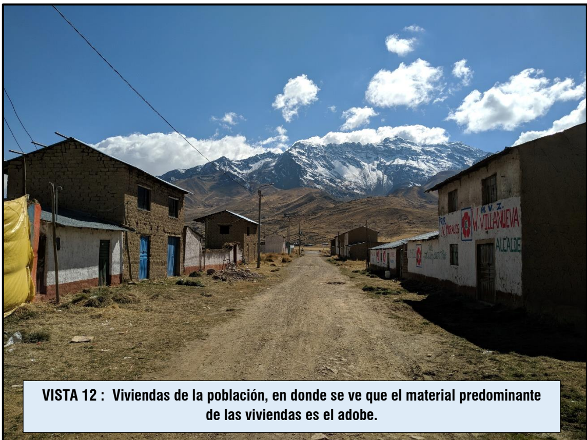
VISTA 12 : Viviendas de la población, en donde se ve que el material predominante de las viviendas es el adobe.