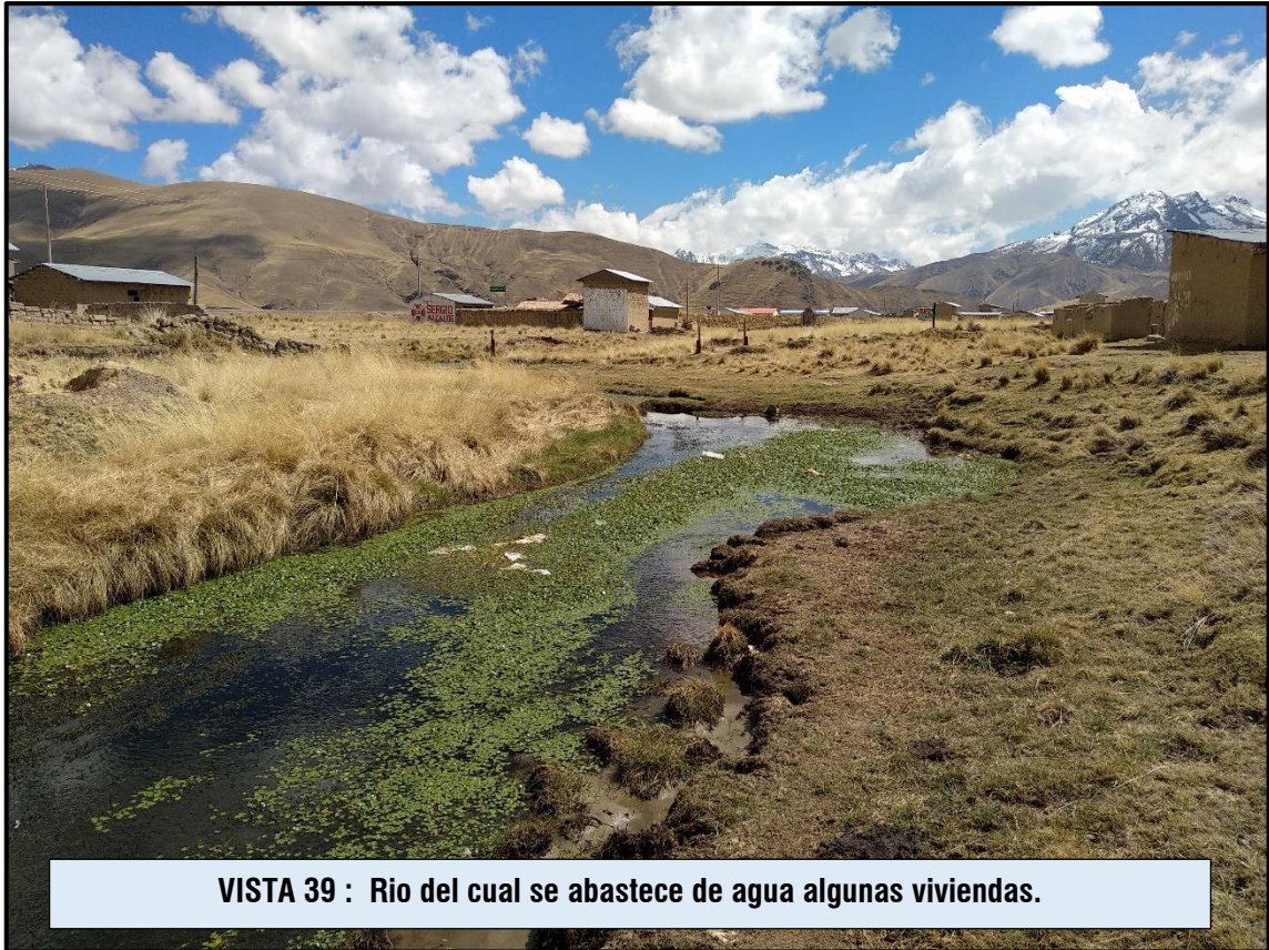
VISTA 39 : Rio del cual se abastece de agua algunas viviendas.