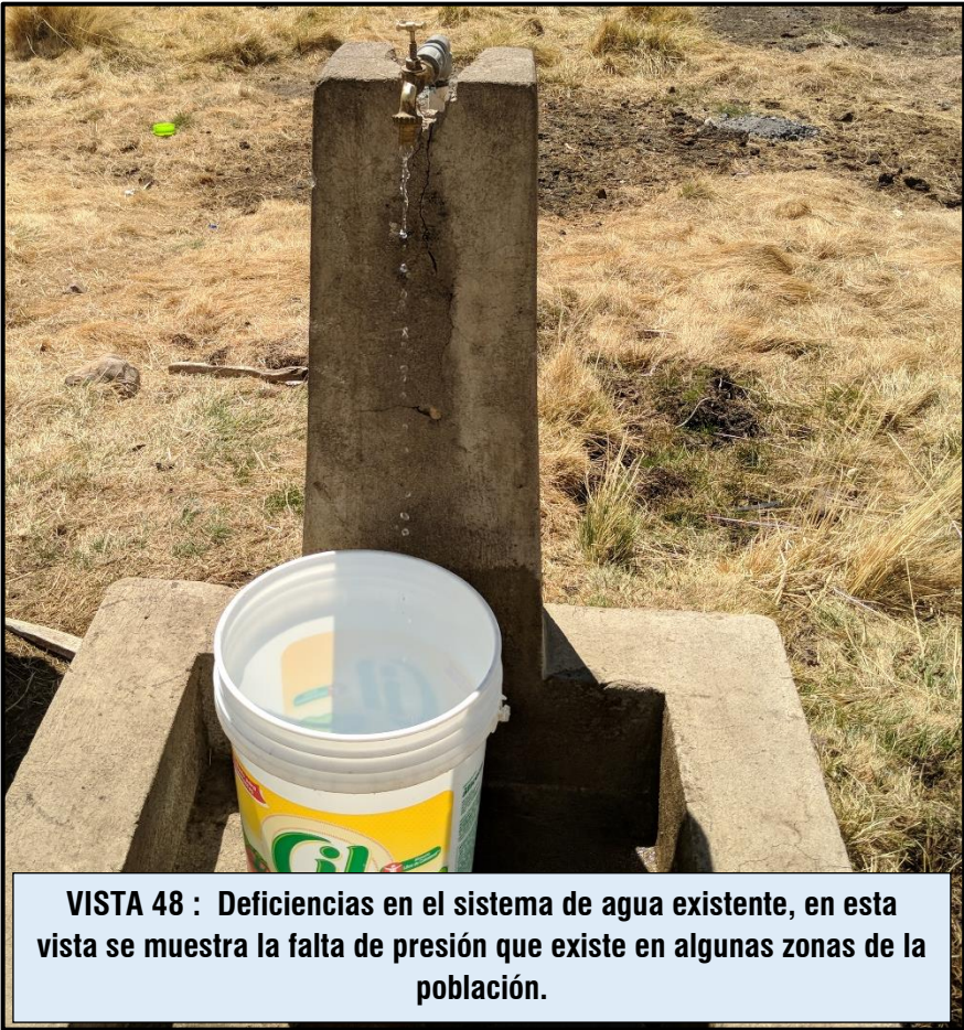
VISTA 48 : Deficiencias en el sistema de agua existente, en esta vista se muestra la falta de presión que existe en algunas zonas de la población.