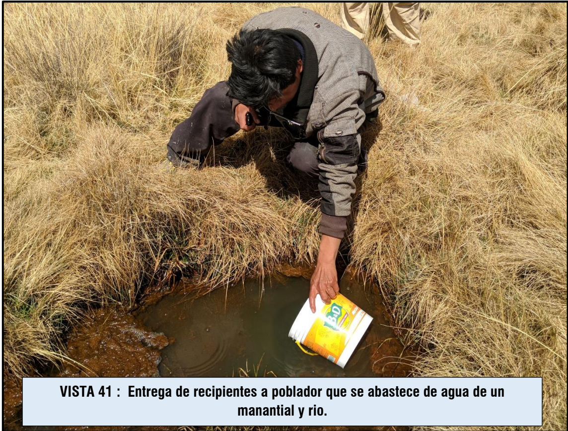
VISTA 41 : Entrega de recipientes a poblador que se abastece de agua de un manantial y rio.