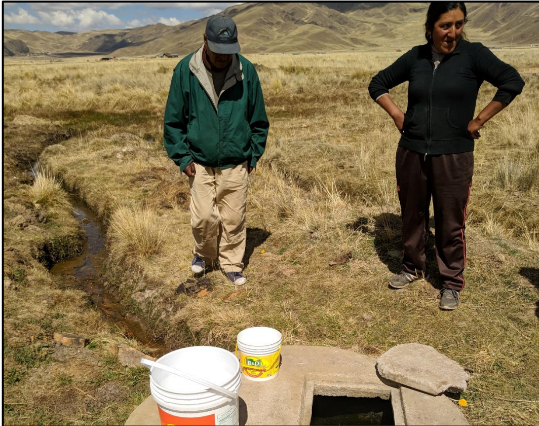
VISTA 33 : Visita y entrega de recipientes a las viviendas que brindaron su apoyo para realizar la presente investigación.