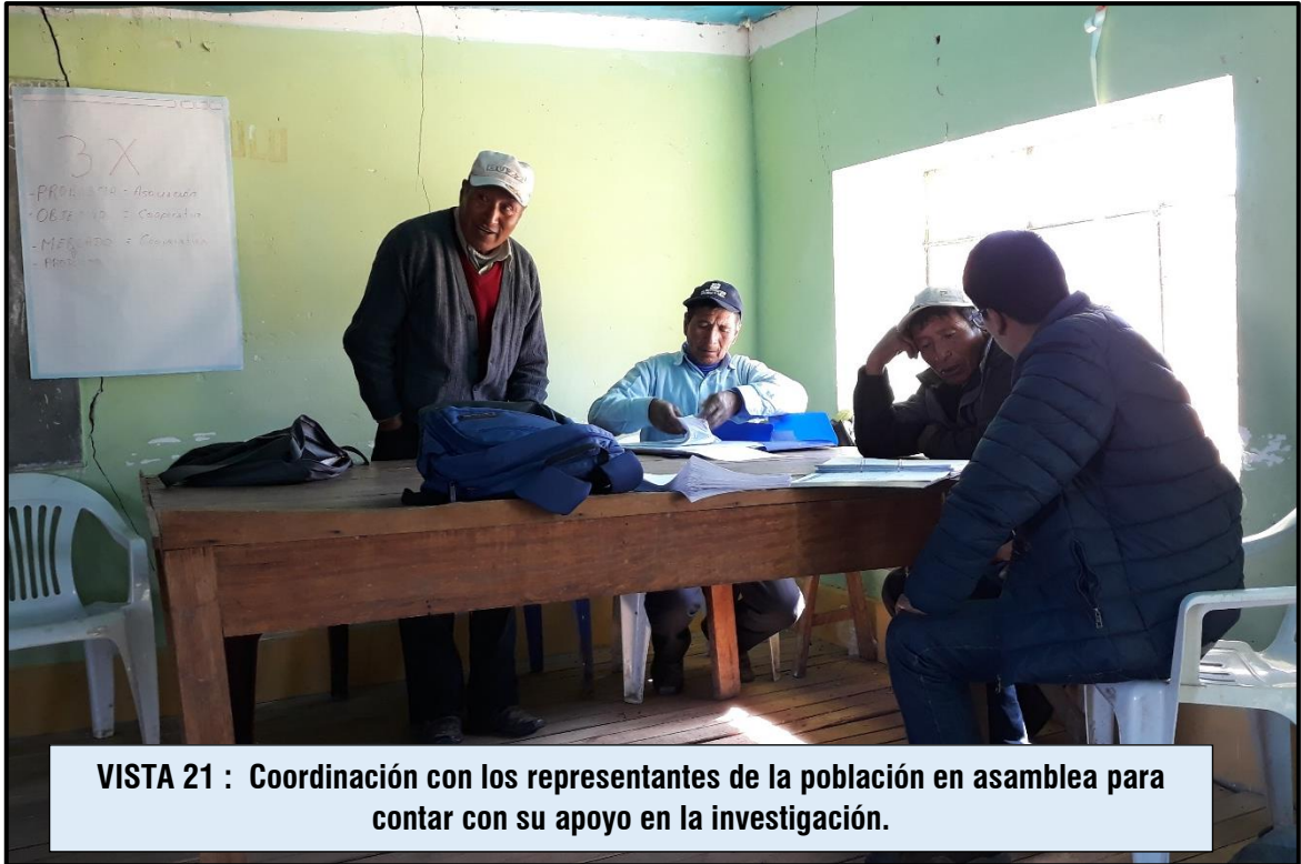
VISTA 21 : Coordinación con los representantes de la población en asamblea para contar con su apoyo en la investigación.