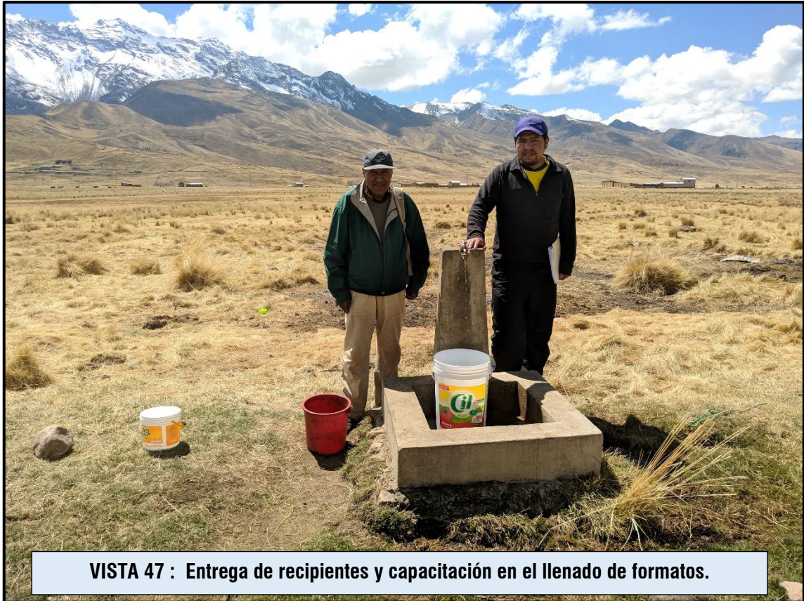
VISTA 47 : Entrega de recipientes y capacitación en el llenado de formatos.