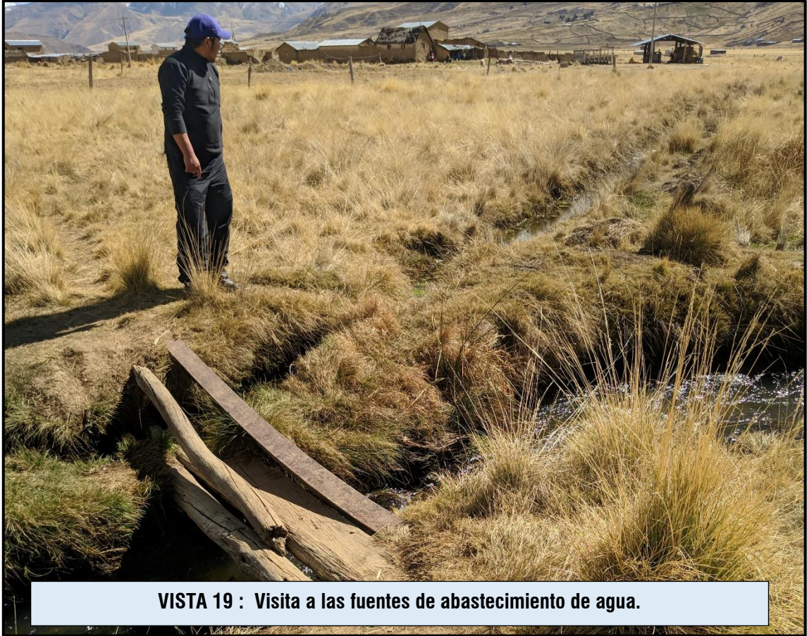
VISTA 19 : Visita a las fuentes de abastecimiento de agua.