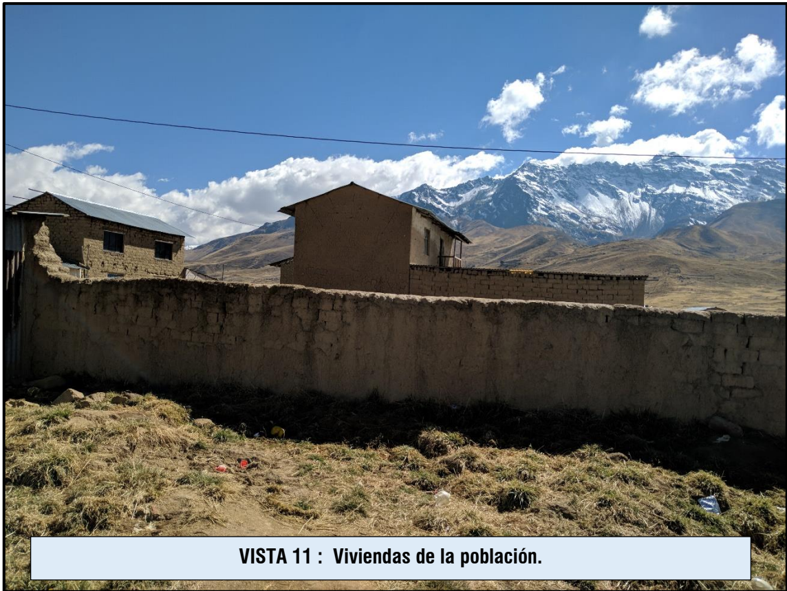
VISTA 11 : Viviendas de la población.