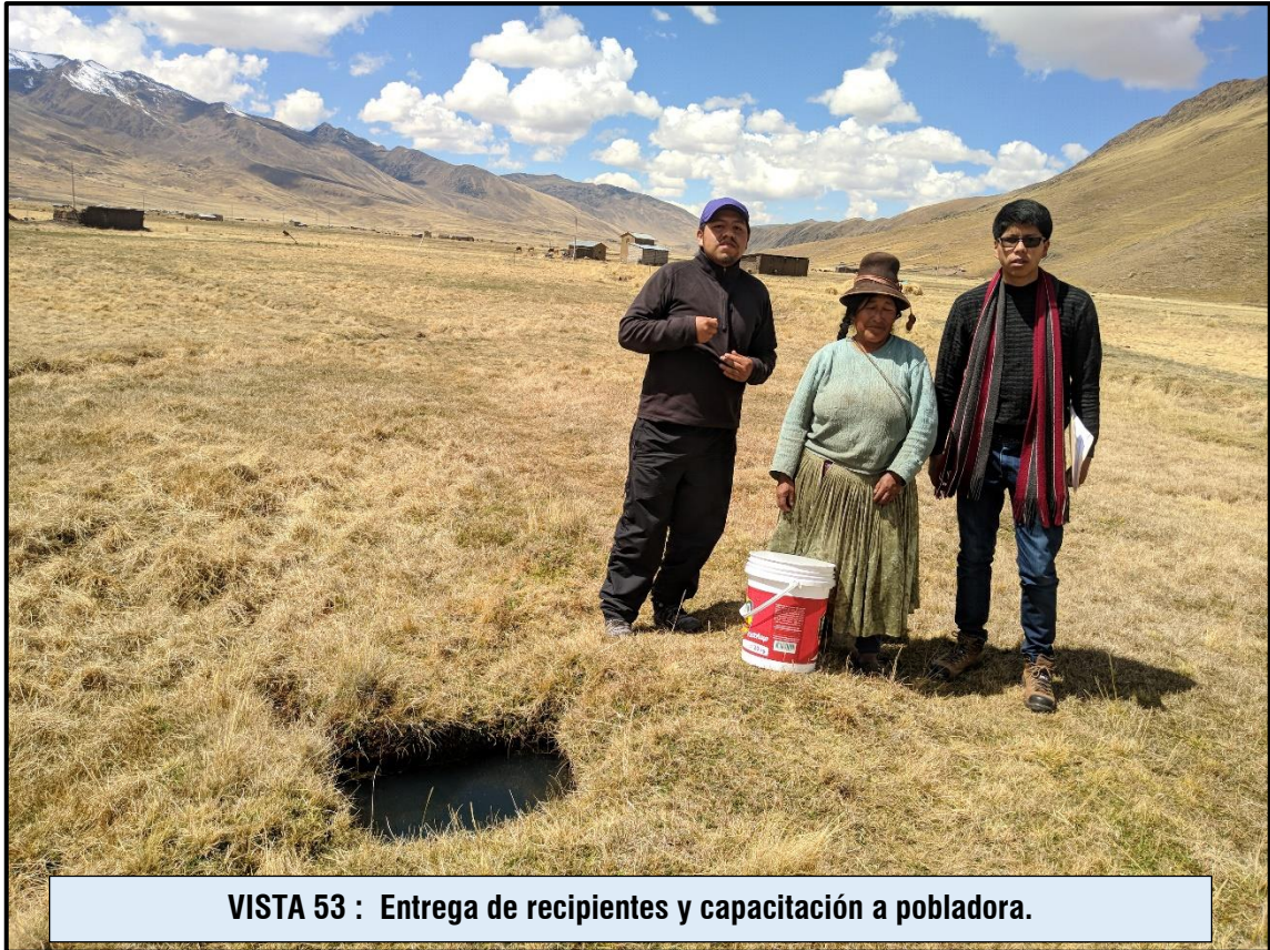
VISTA 53 : Entrega de recipientes y capacitación a pobladora.