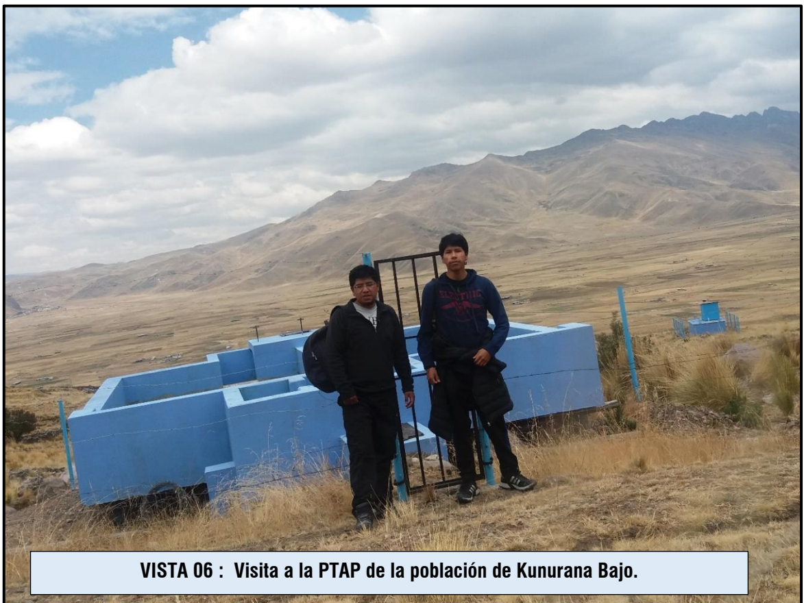
VISTA 06 : Visita a la PTAP de la población de Kunurana Bajo.