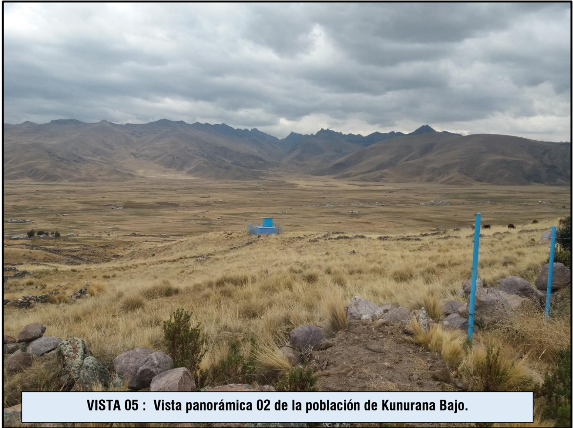
VISTA 05 : Vista panorámica 02 de la población de Kunurana Bajo.