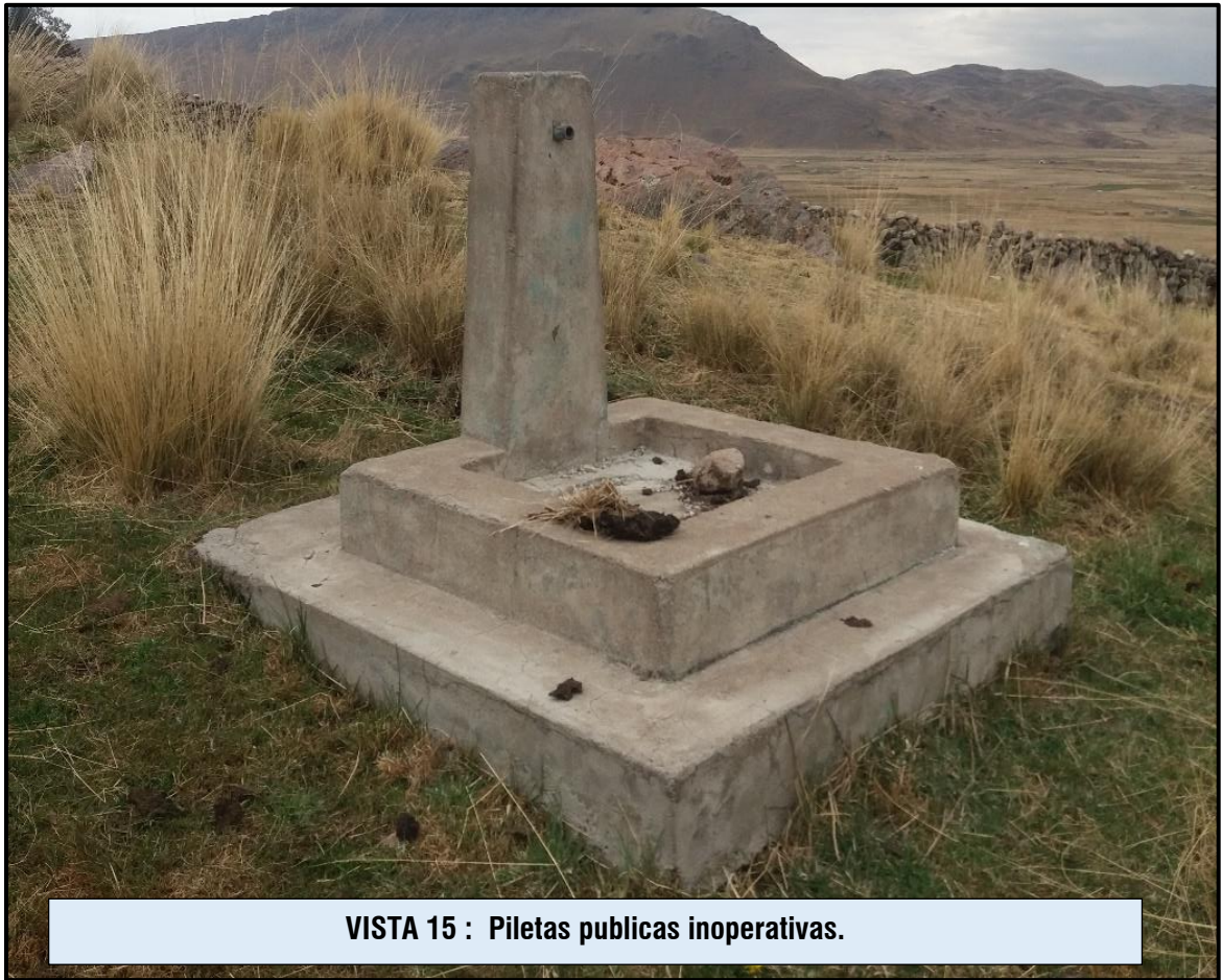
VISTA 15 : Piletas publicas inoperativas.