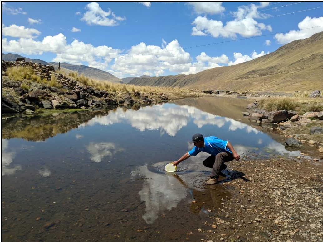
VISTA 50 : Fuente de abastecimiento de agua del poblador.