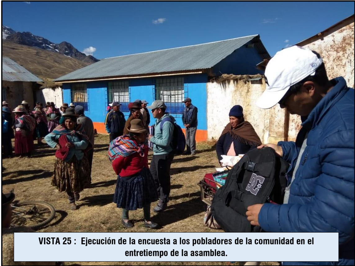
VISTA 25 : Ejecución de la encuesta a los pobladores de la comunidad en el entretiempo de la asamblea.