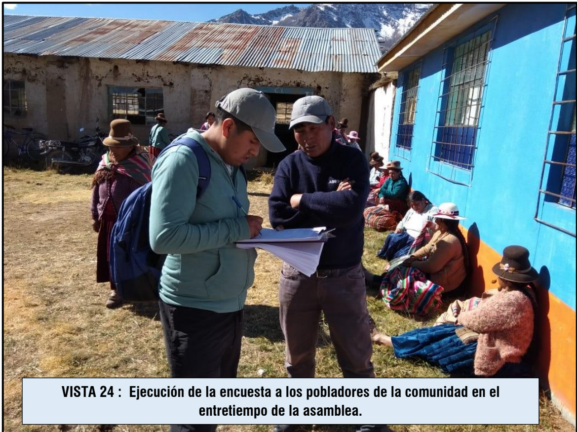
VISTA 24 : Ejecución de la encuesta a los pobladores de la comunidad en el entretiempo de la asamblea.