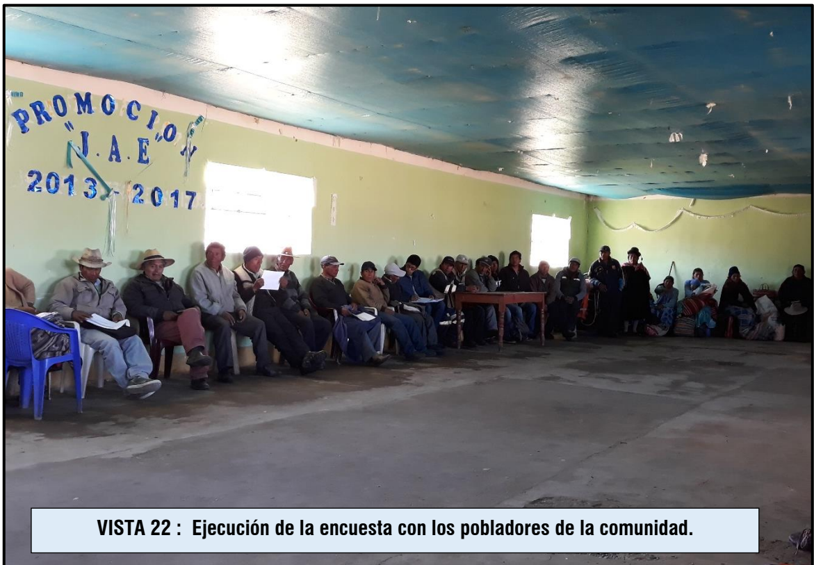
VISTA 22 : Ejecución de la encuesta con los pobladores de la comunidad.