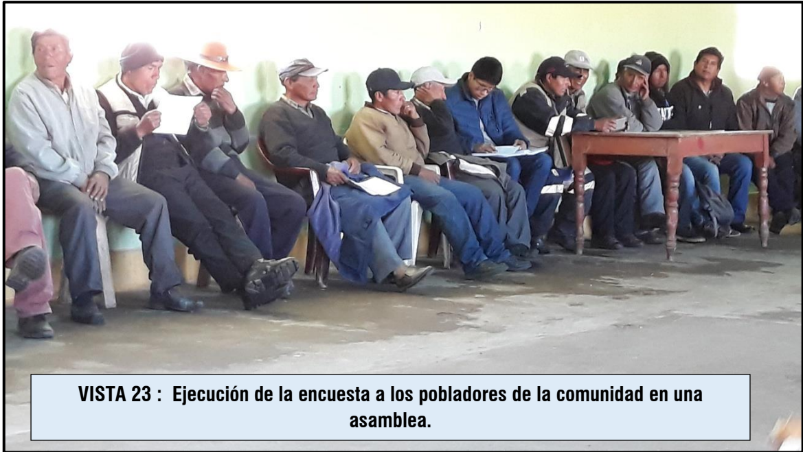
VISTA 23 : Ejecución de la encuesta a los pobladores de la comunidad en una asamblea.