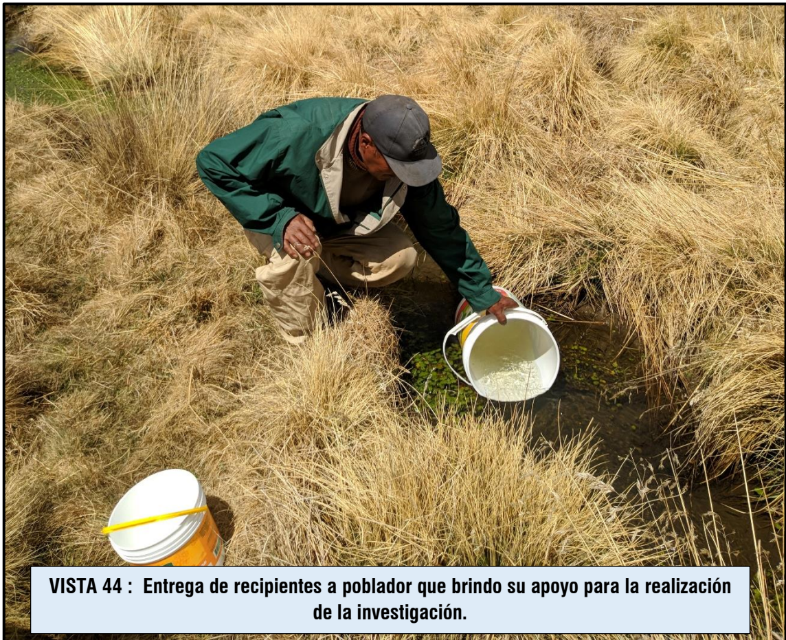
VISTA 44 : Entrega de recipientes a poblador que brindo su apoyo para la realización de la investigación.