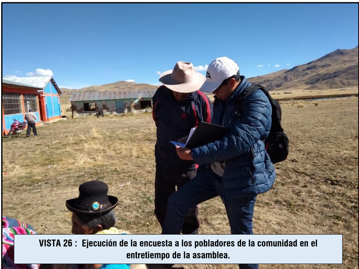
VISTA 26 : Ejecución de la encuesta a los pobladores de la comunidad en el entretiempo de la asamblea.