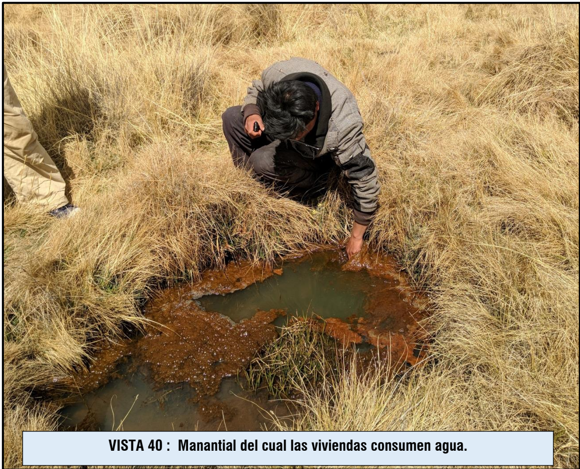
VISTA 40 : Manantial del cual las viviendas consumen agua.