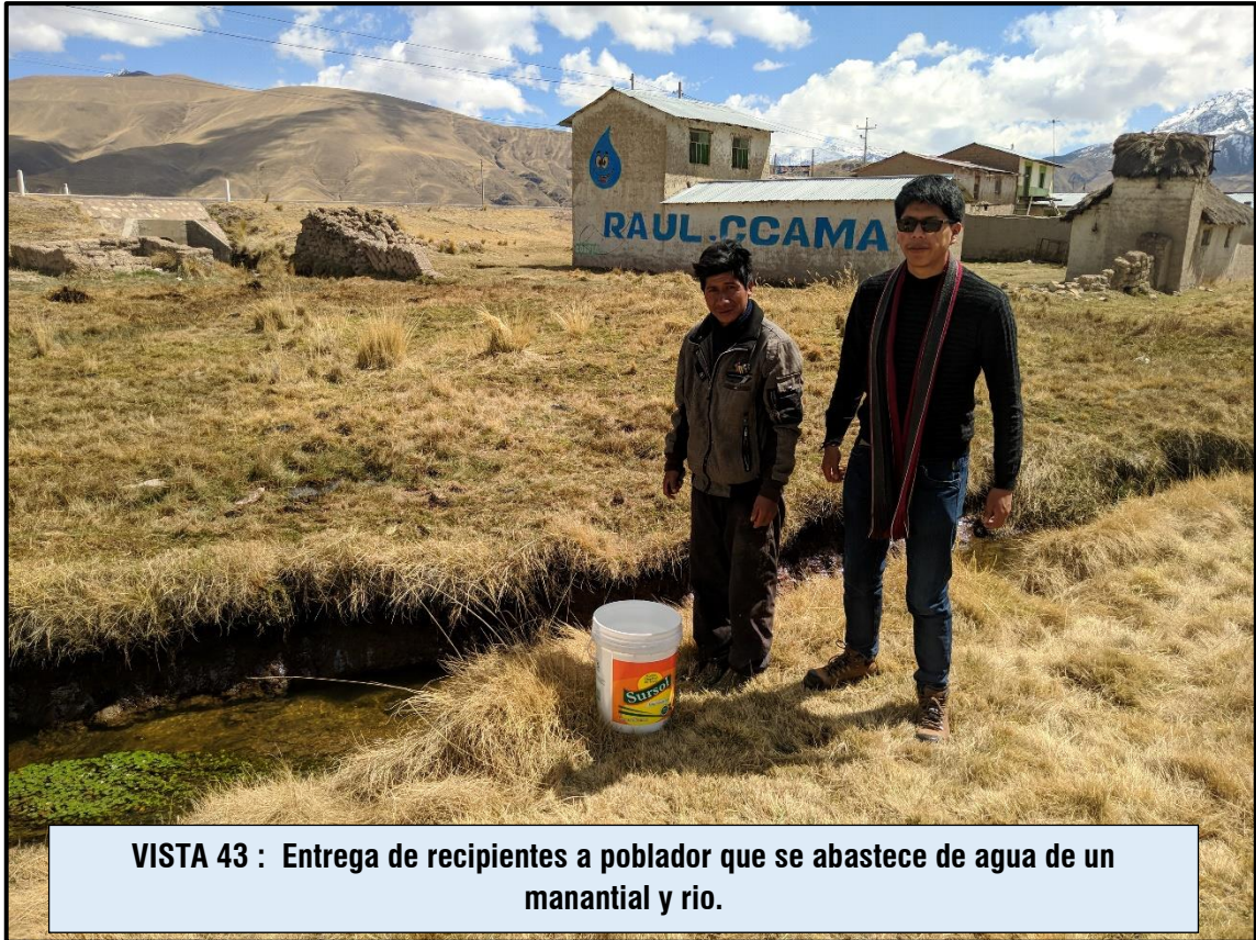
VISTA 43 : Entrega de recipientes a poblador que se abastece de agua de un manantial y rio.