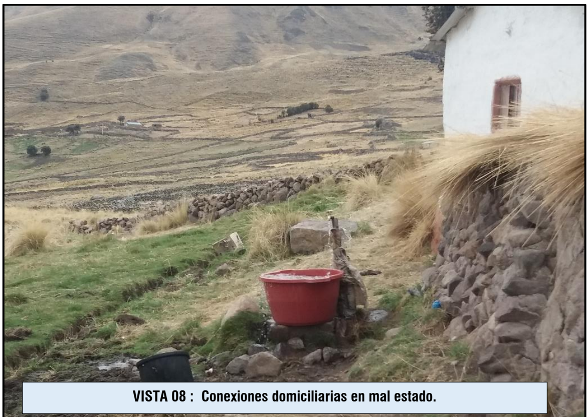
VISTA 08 : Conexiones domiciliarias en mal estado.