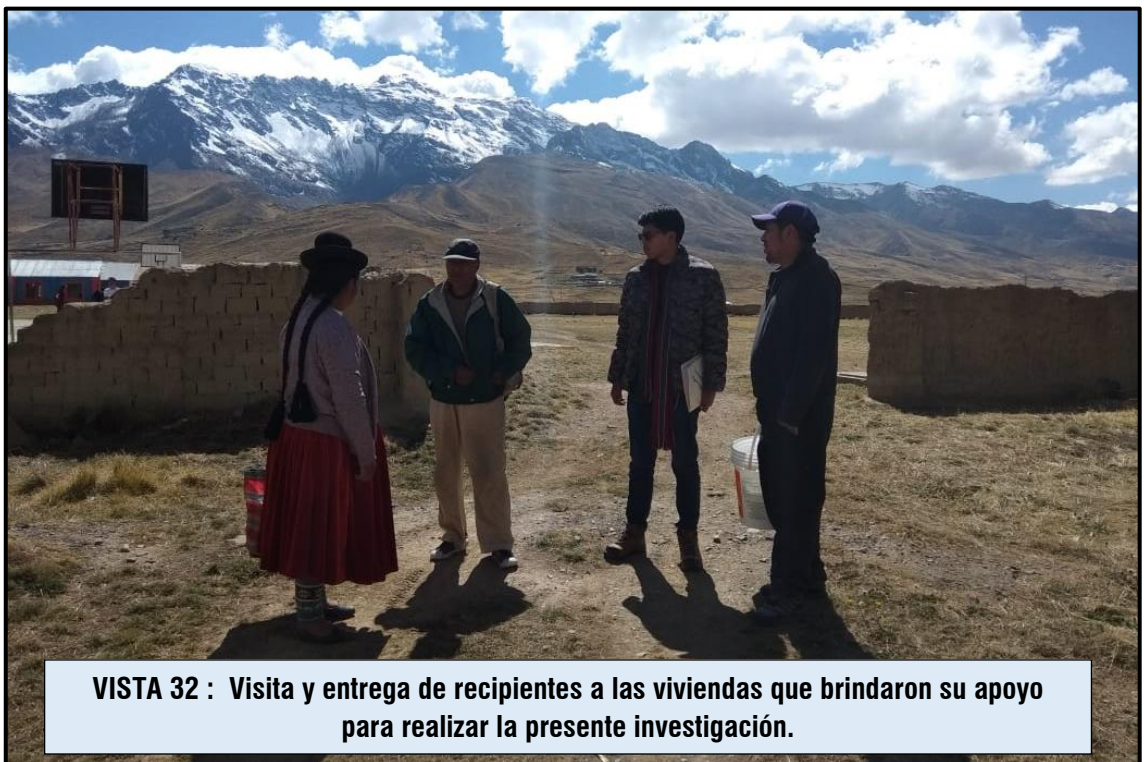
VISTA 32 : Visita y entrega de recipientes a las viviendas que brindaron su apoyo para realizar la presente investigación.