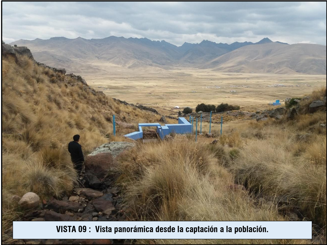
VISTA 09 : Vista panorámica desde la captación a la población.