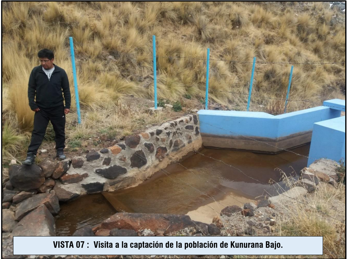
VISTA 07 : Visita a la captación de la población de Kunurana Bajo.