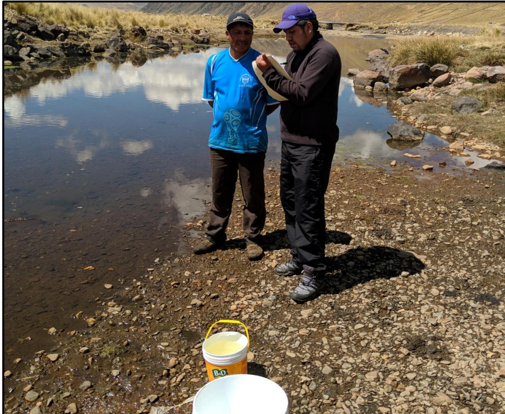
VISTA 49 : Entrega de recipientes y capacitación en el llenado de formatos.