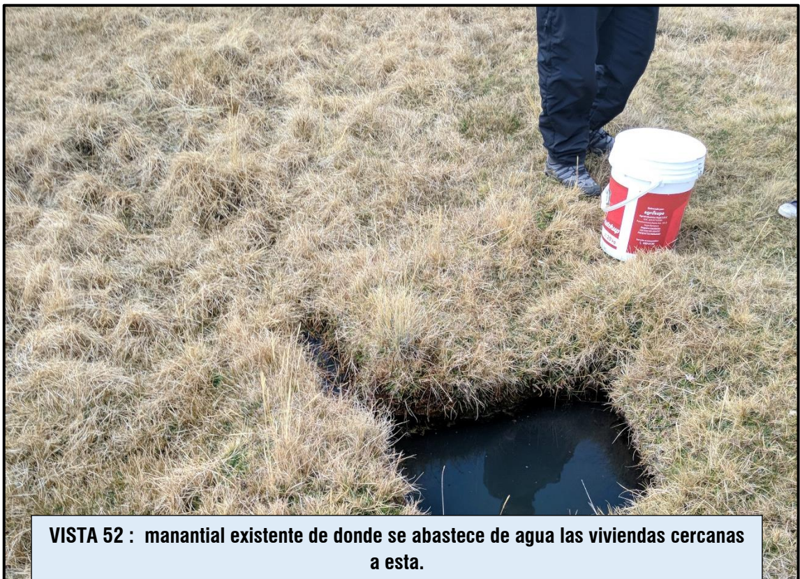
VISTA 52 : manantial existente de donde se abastece de agua las viviendas cercanas a esta.