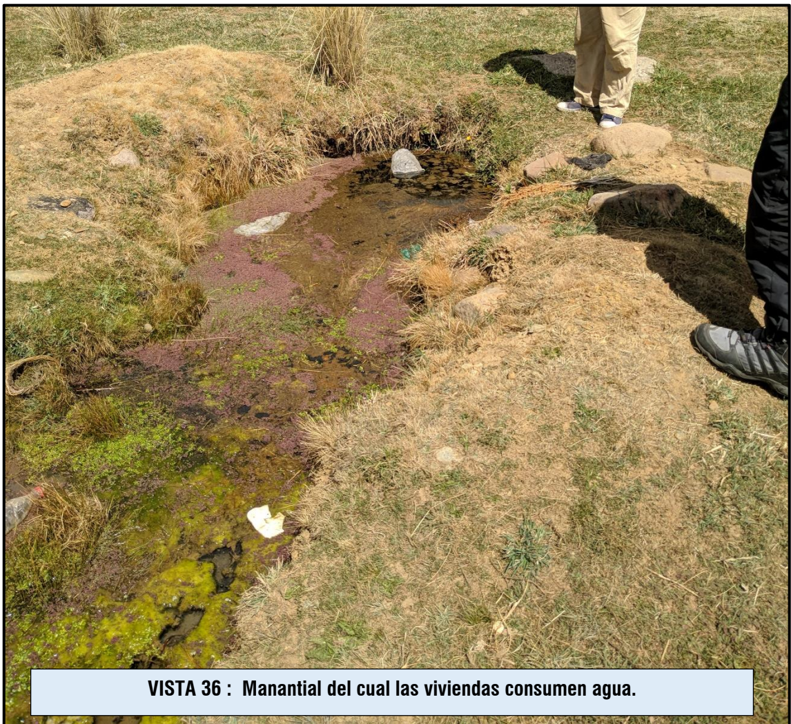
VISTA 36 : Manantial del cual las viviendas consumen agua.