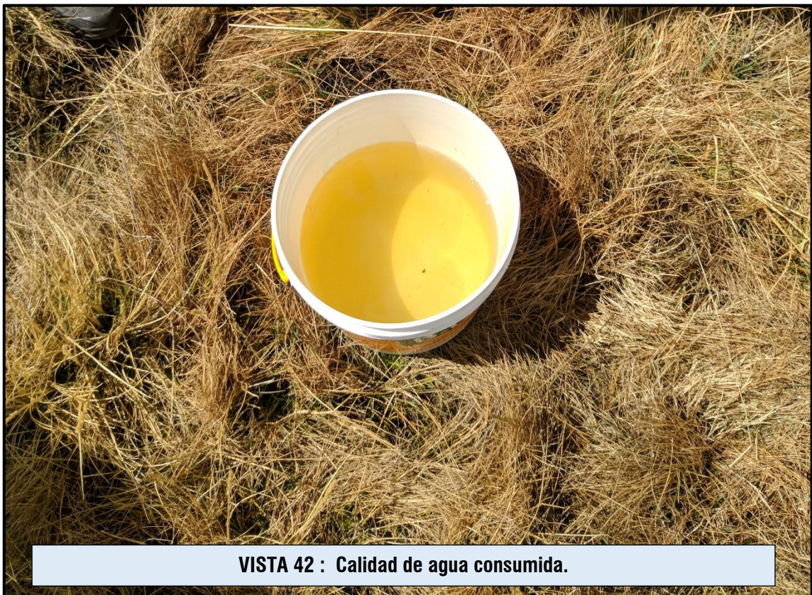
VISTA 42 : Calidad de agua consumida.