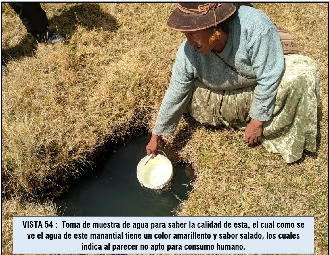
VISTA 54 : Toma de muestra de agua para saber la calidad de esta, el cual como se ve el agua de este manantial tiene un color amarillento y sabor salado, los cuales indica al parecer no apto para consumo humano.