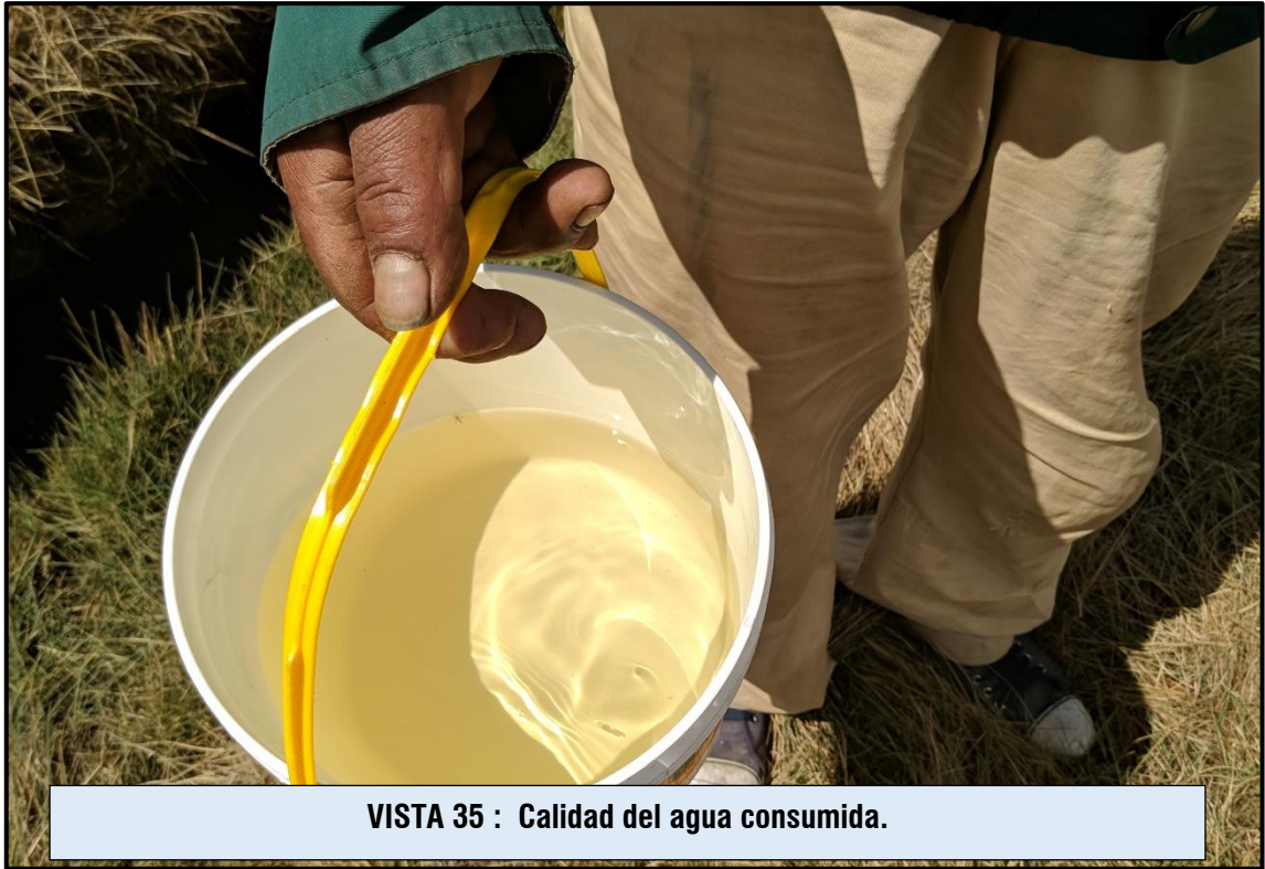
VISTA 35 : Calidad del agua consumida.