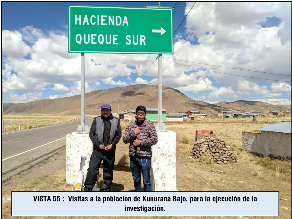
VISTA 55 : Visitas a la población de Kunurana Bajo, para la ejecución de la investigación.