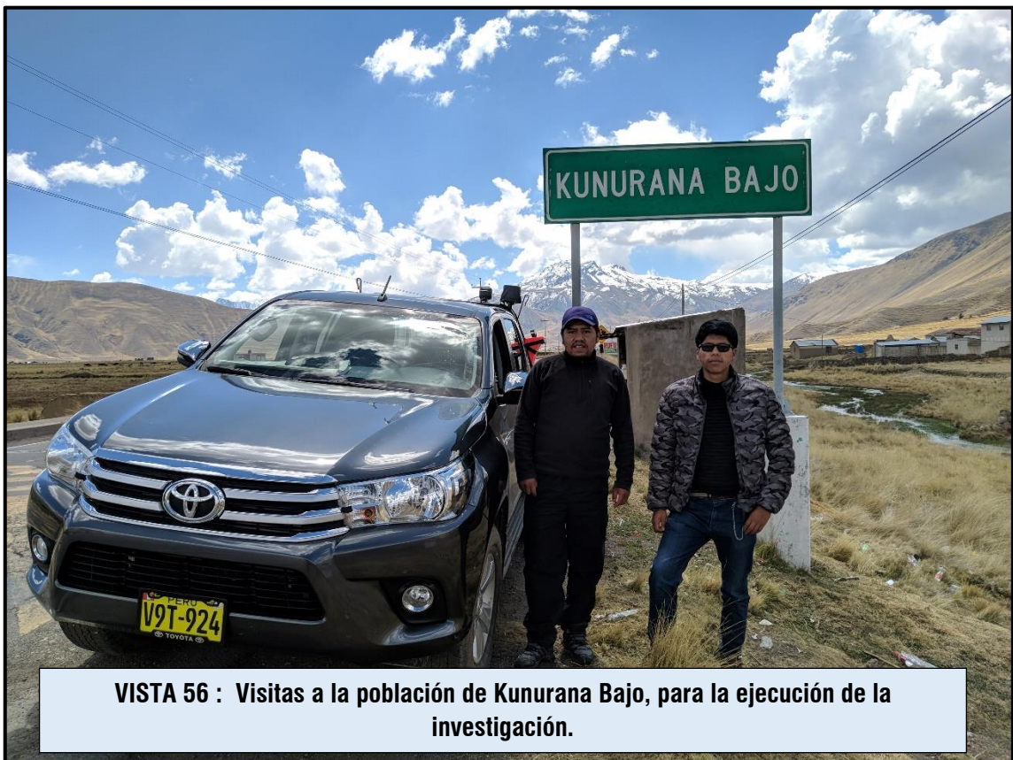
VISTA 56 : Visitas a la población de Kunurana Bajo, para la ejecución de la investigación.