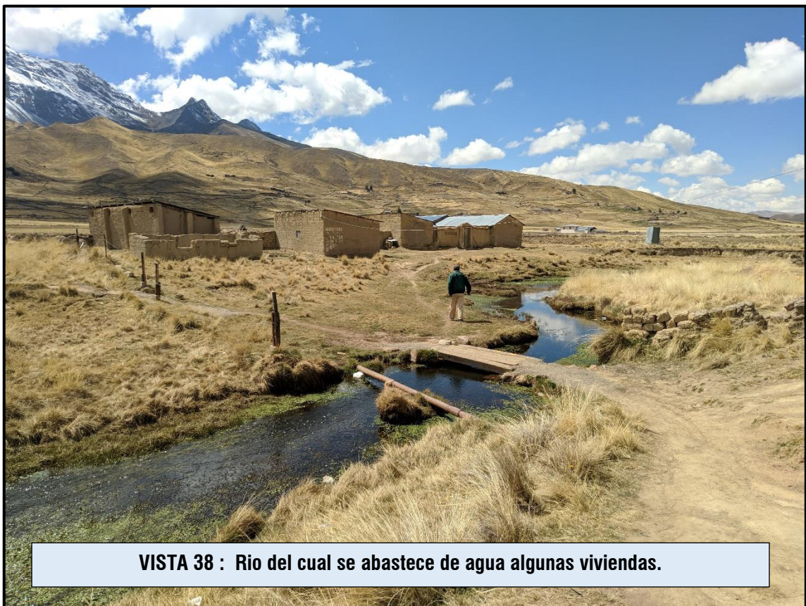
VISTA 38 : Rio del cual se abastece de agua algunas viviendas.