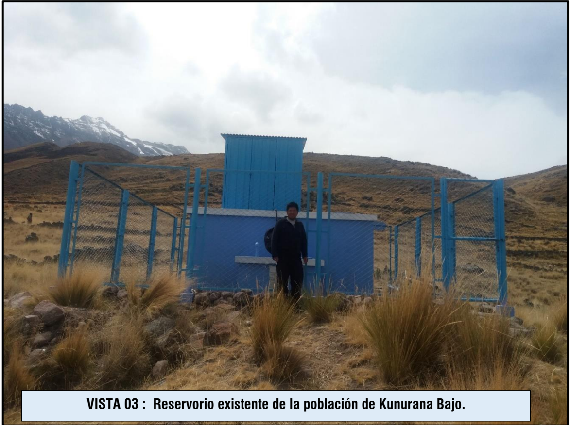
VISTA 03 : Reservorio existente de la población de Kunurana Bajo.