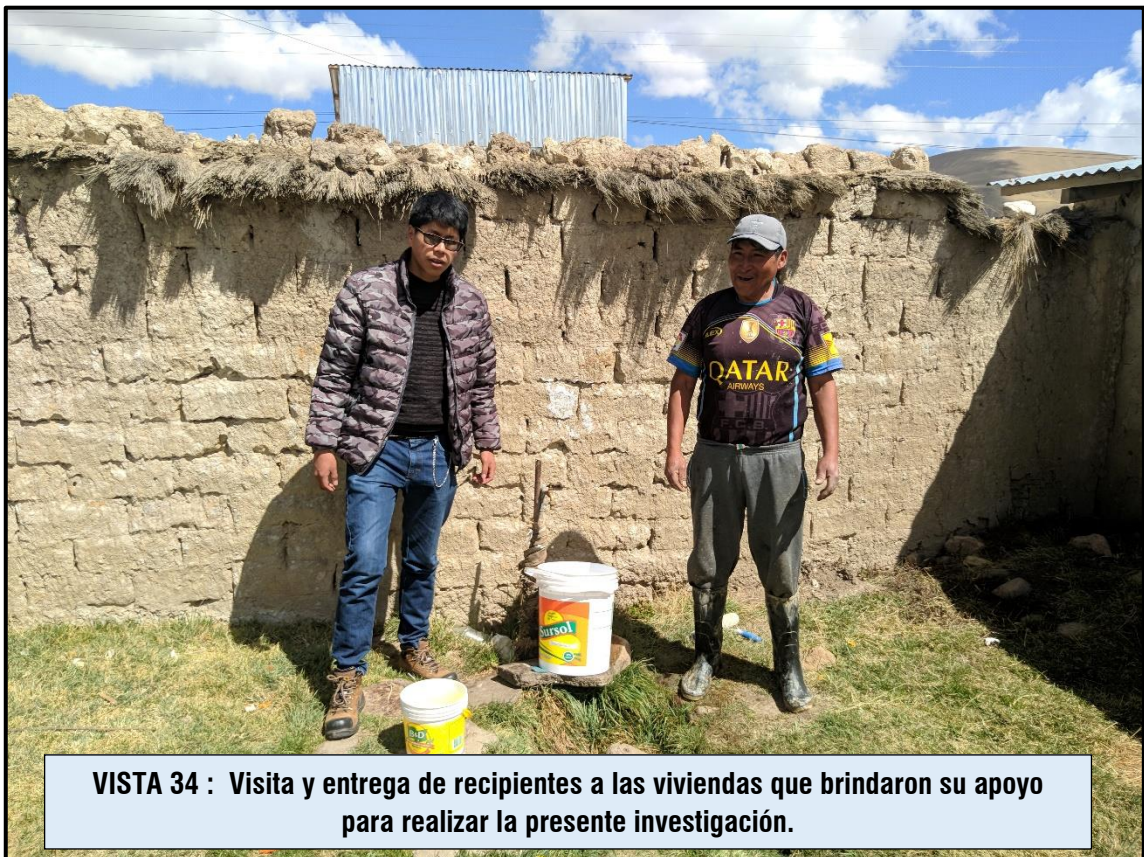
VISTA 34 : Visita y entrega de recipientes a las viviendas que brindaron su apoyo para realizar la presente investigación.