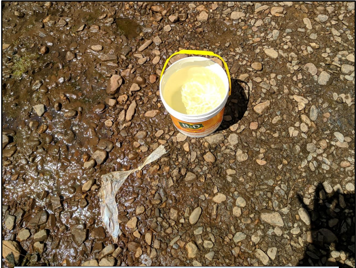
VISTA 51 : Calidad de agua consumida por los pobladores aledaños al río.