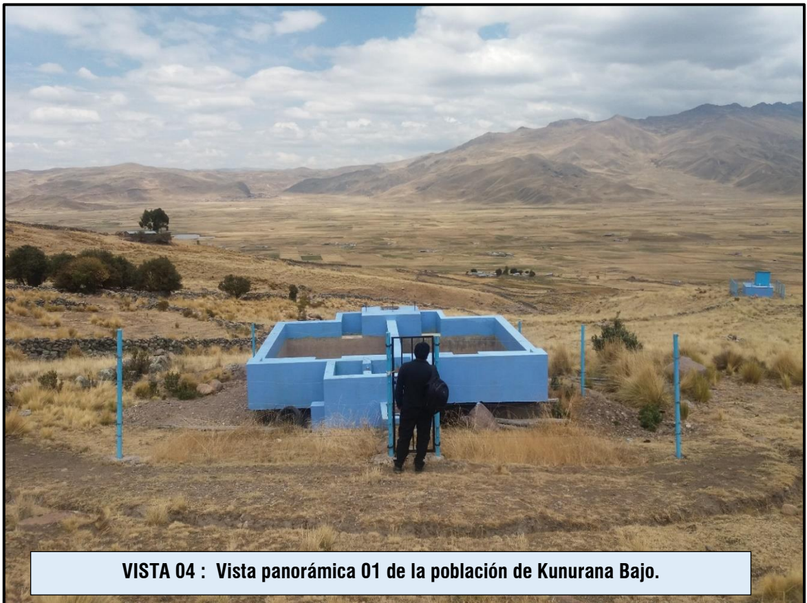
VISTA 04 : Vista panorámica 01 de la población de Kunurana Bajo.