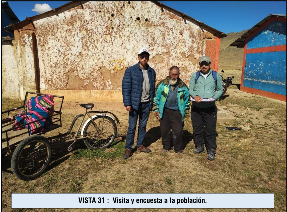
VISTA 31 : Visita y encuesta a la población.