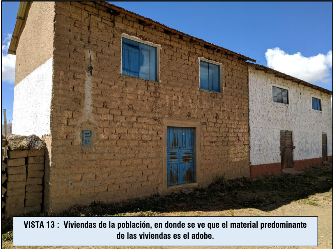
VISTA 13 : Viviendas de la población, en donde se ve que el material predominante de las viviendas es el adobe.