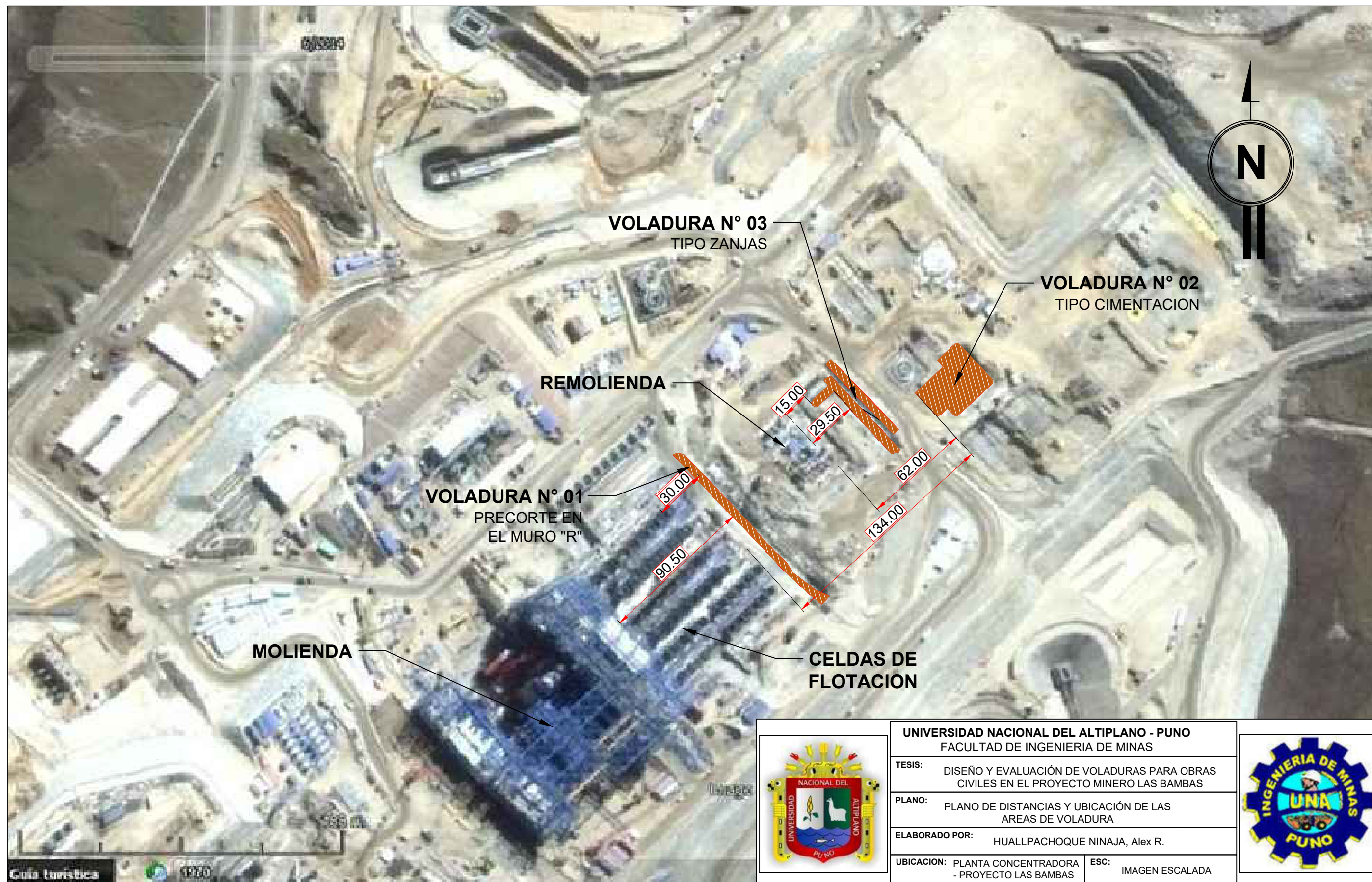
Figura N° 22: Plano de distancias y ubicación de las áreas de voladura