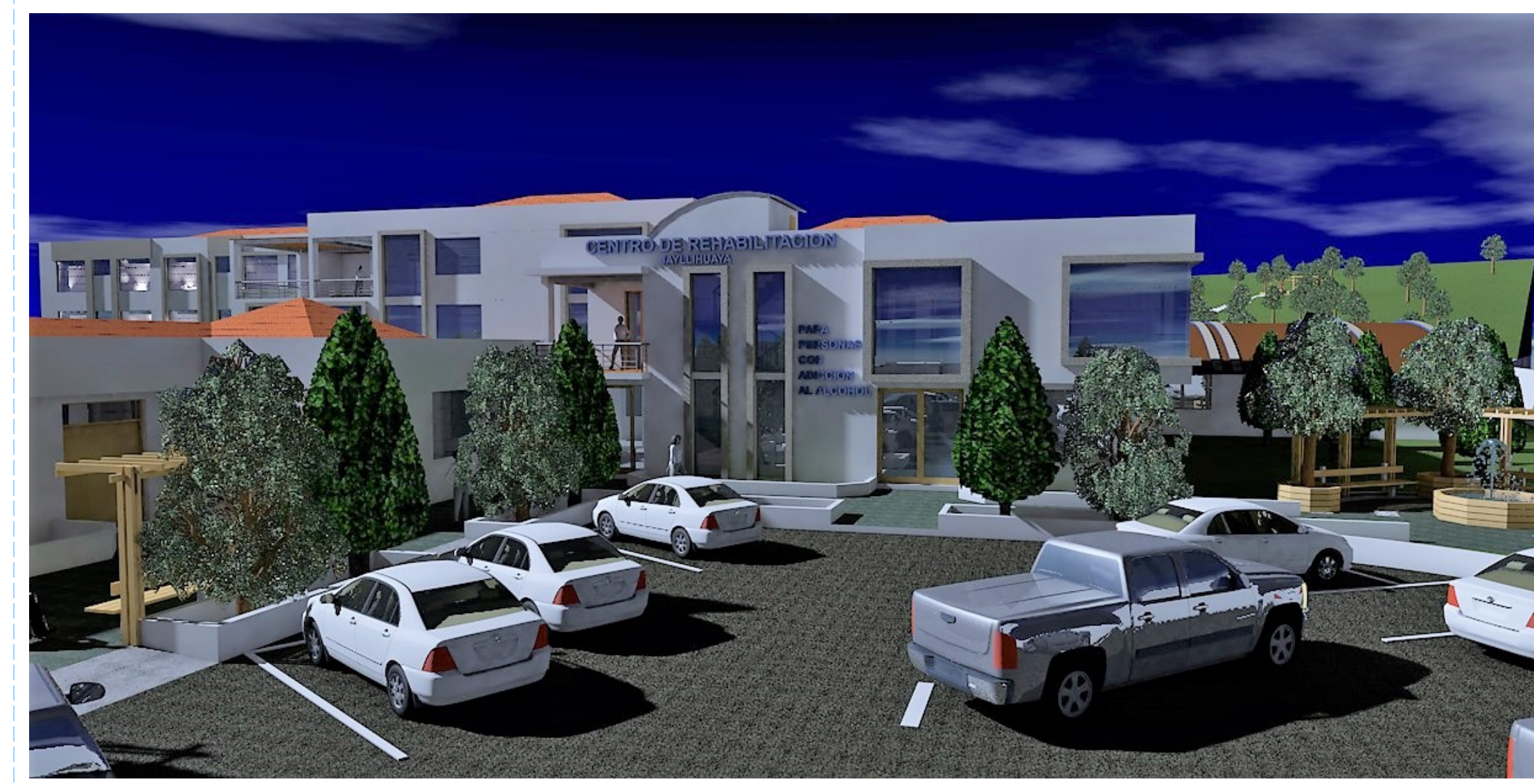
PERSPECTIVA 06 ZONA DE SERVICIOS GENERALES