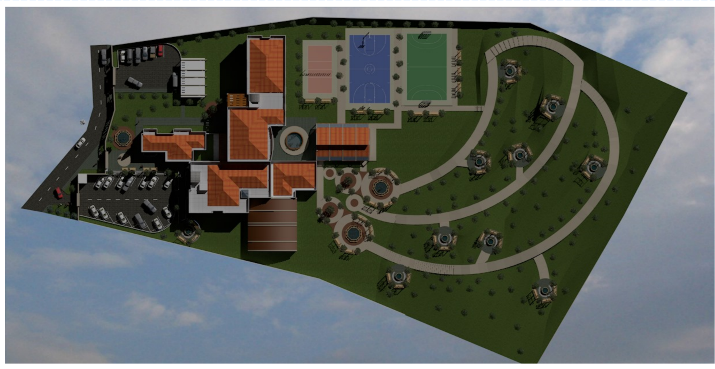
VISTA AEREA DEL CONJUNTO