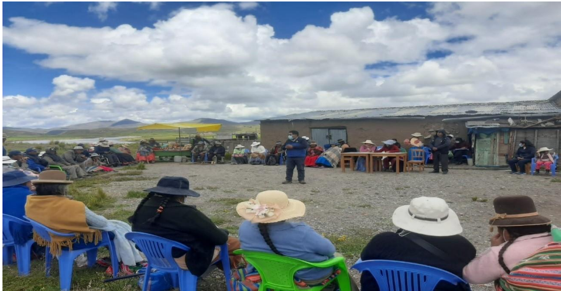
Imagen 2: Cosecha de la quinua donde participa los beneficiarios en la comunidad de Alpacollo (zona media Ilave).