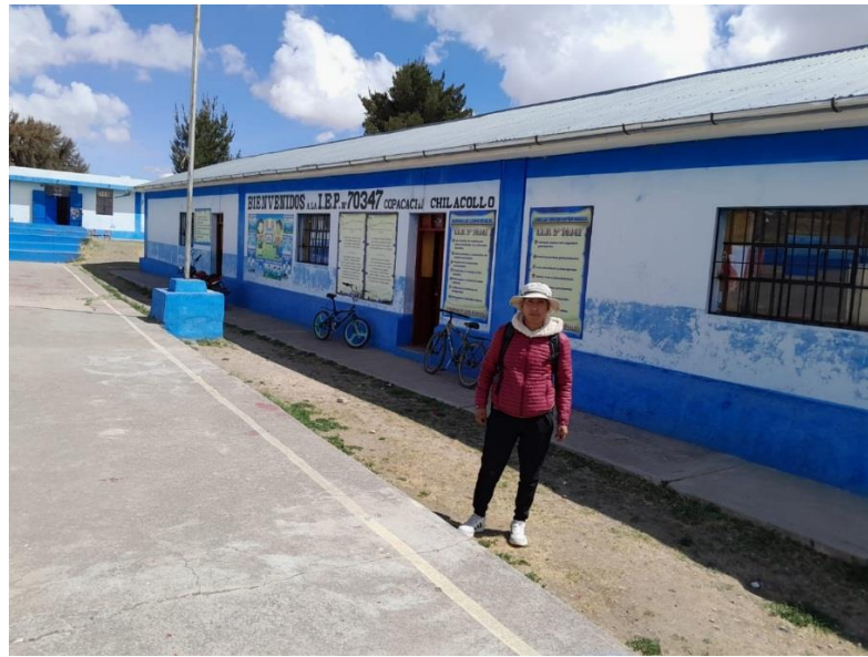
En la imagen se observa la I.E.P. de la comunidad Copacachi Ichunta