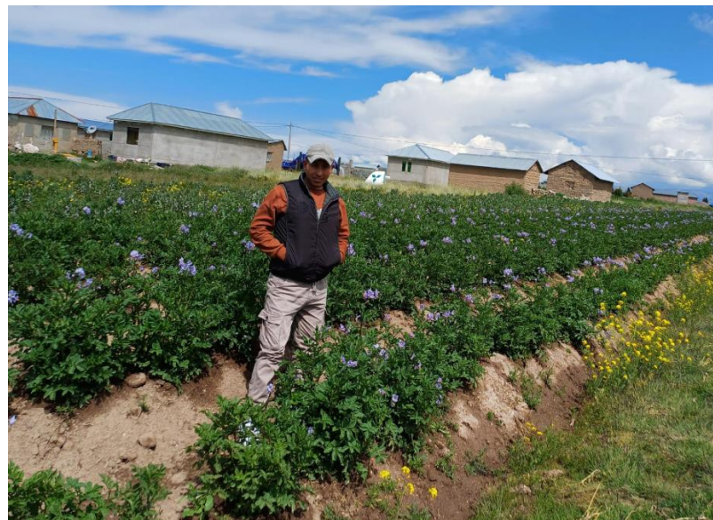
En la imagen se observa uno de los cultivos de la comunidad Copacachi Ichunta